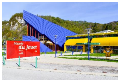
Alain DOIRE / Bourgogne-Franche-Comté Tourisme

Que ce soit dans une abbaye, un vignoble, un musée, un camping ou encore un château, voici la liste des « Fantastic Picnic » 2021 ici . Plus d'informations ici .