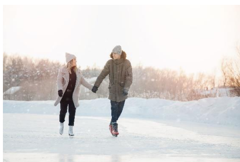
Patins à glace

Après ces moments de déconnexion, direction Les Rives Sauvages pour se réchauffer et entamer une belle soirée. Place à la douceur dans ce cocon qui allie modernité et détente. Les suites chaleureuses, le sauna avec vue sur le lac Saint-Point participent grandement au charme du lieu.